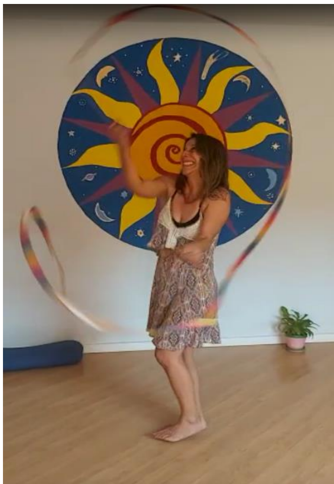
Ensaio realizado pela Lívia Matos