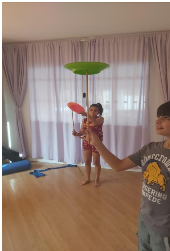
Ensaio de aula de YOGA com as crianças.