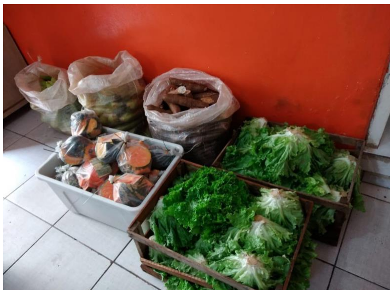
Entrega de legumes e verduras em conjunto com Coletivo Ponto a Ponto