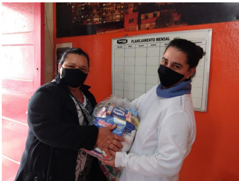
Entrega de cestas básicas em conjunto com o Coletivo Ponto a Ponto