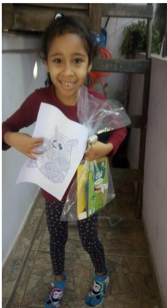
Entrega de atividades para os alunos