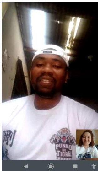
Reunião de comunicação e planejamento