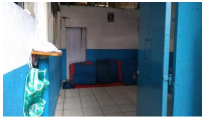
Espaço antes da reforma