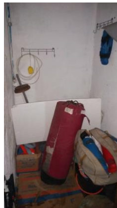
Antes da reforma