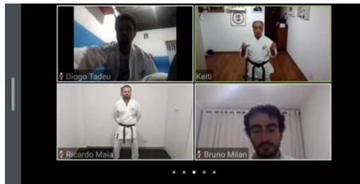
Aula para adultos