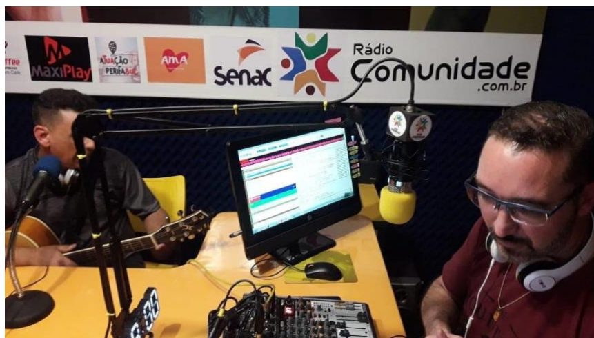
Transmissão da Live – 25 anos Pagode do Bom