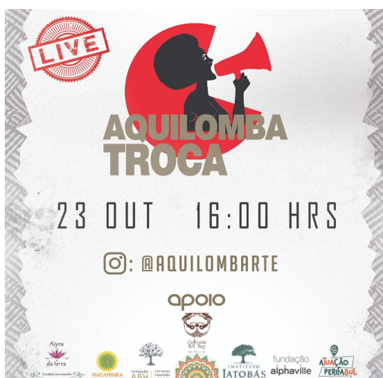
Flyer de divulgação da live sobre Autocuidado.