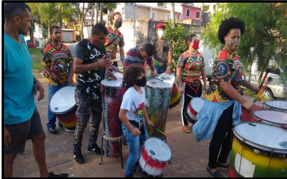
Oficinas Fomentos dos Tambores na Praça do Bambuzal