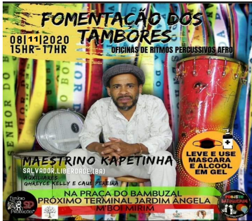
Fomento dos Tambores na Praça do Bambuzal