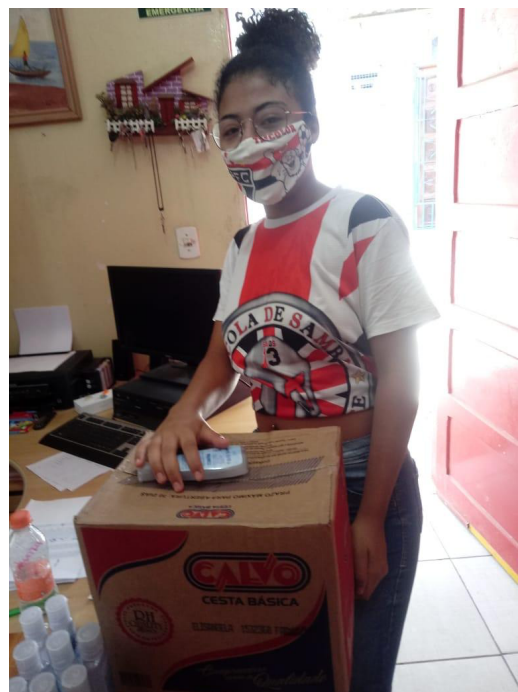
Responsáveis retirando cestas básicas