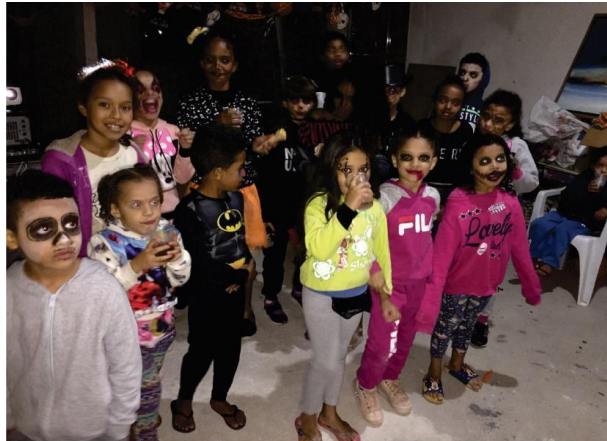
Festa de halloween