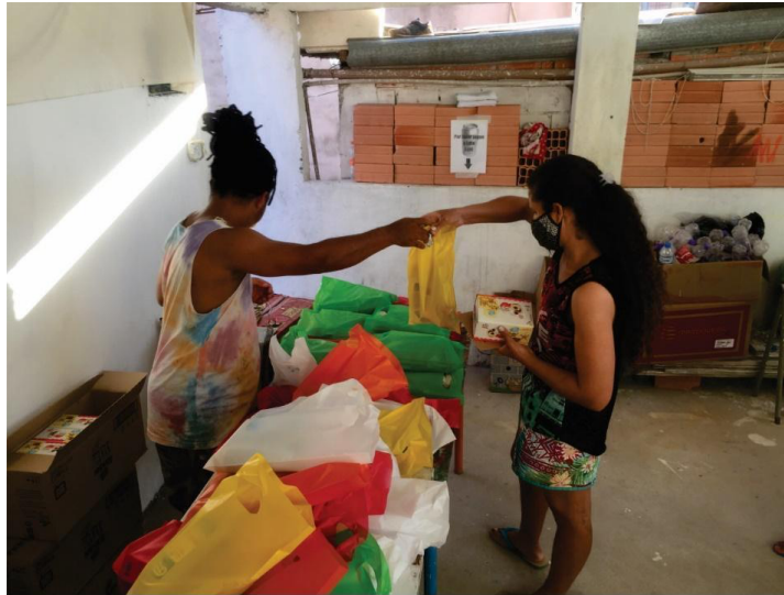
Entregas de kits doados pelo Projeto Viegas