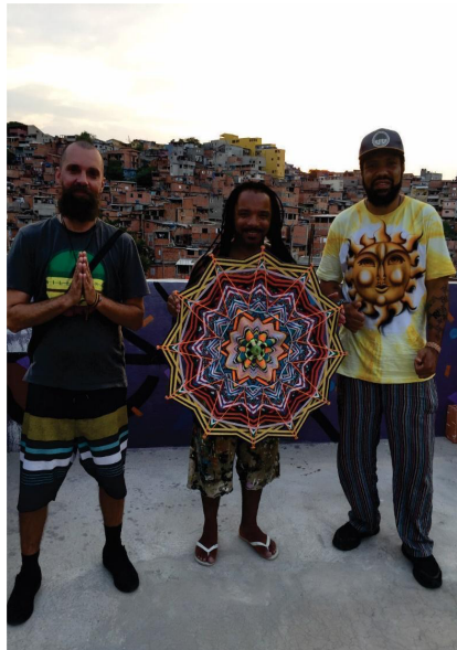
Visita dos educadores de mandala