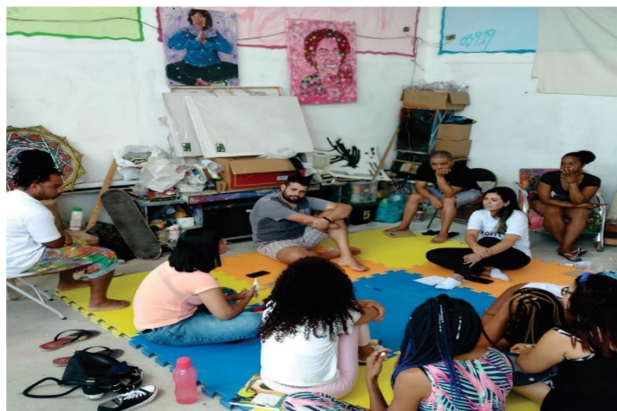
Encontro com lideranças de diversos estados