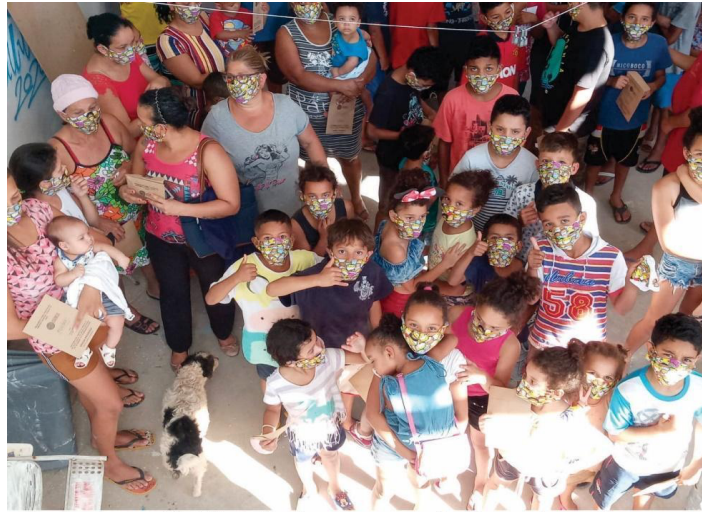
Distribuição de mascaras doadas pelos Grafiteiros os Gêmeos