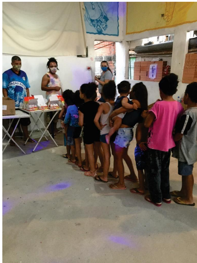
Entregas de chocolates doados pelo Projeto Viegas