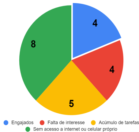
Participação dos educandos

Como adiantamos na descrição inicial, optamos em seguir com a etapa de produção do podcast (produto de conclusão do módulo) com os quatro educandos mais engajados. Pois entendemos que dessa forma, conseguiremos mantê-los motivados e, ao mesmo tempo, poderemos estimular que os outros educandos se motivem a continuar conosco em 2021.