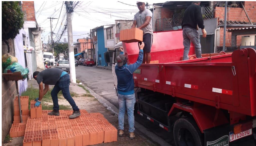
entrega de material