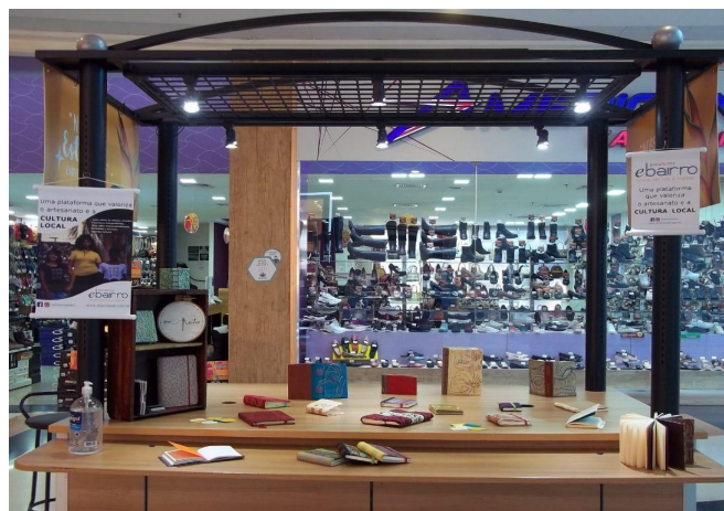
Stand Montado pela Thamata da Em.Feito no Shopping Campo Limpo