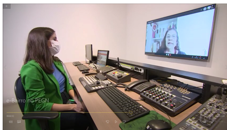
Entrevistadora da PEGN