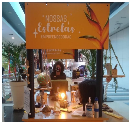
Studio Lilian Seraos no Stand do Shopping Campo Limpo