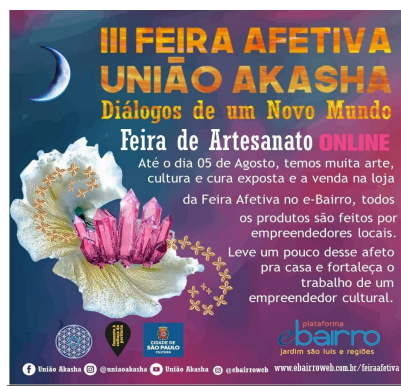
Arte de divulgação da Feira de Artesanatos Online da Feira Afetiva da União Akasha em parceria com o e-Bairro