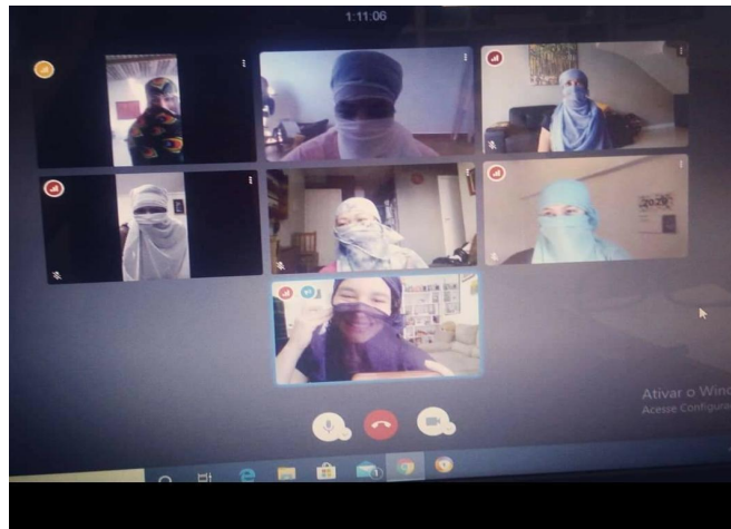
Aula de dança do ventre