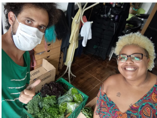
ENTREGA DE ORGÂNICOS PELO COLETIVO EPARREH