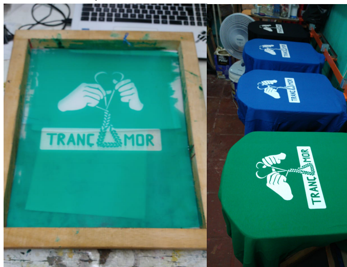
TELA DE SILK SCREEN E CONFEÇÃO DE NOSSAS CAMISETAS NO ATELIÊ VALGREEN

IMAGEM PARA POST DE NOSSO INSTAGRAM QUE INFORMA UM DOS CARDÁPIOS COM INFORMAÇÕES DA NUTRICIONISTA