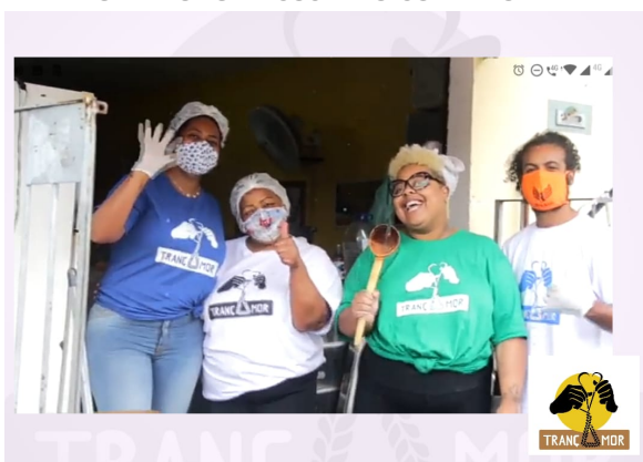
EQUIPE DA COZINHA COM AS NOSSAS PRIMEIRAS CAMISETAS ADQUIRIDAS