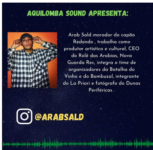
Biografia Dj Arab Sald