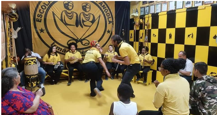
Evento de Encerramento das Atividades/2020