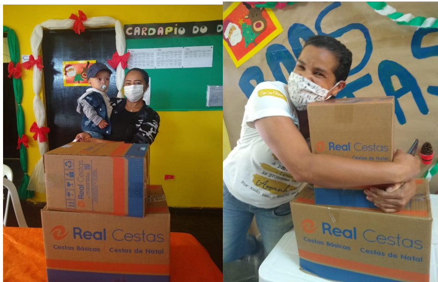
Famílias beneficiadas com as Cestas Básicas