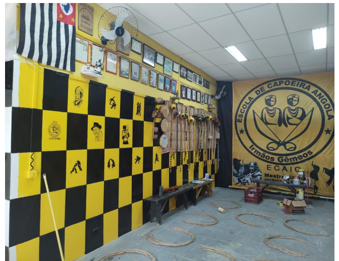
Reforma da Escola de Capoeira Angola