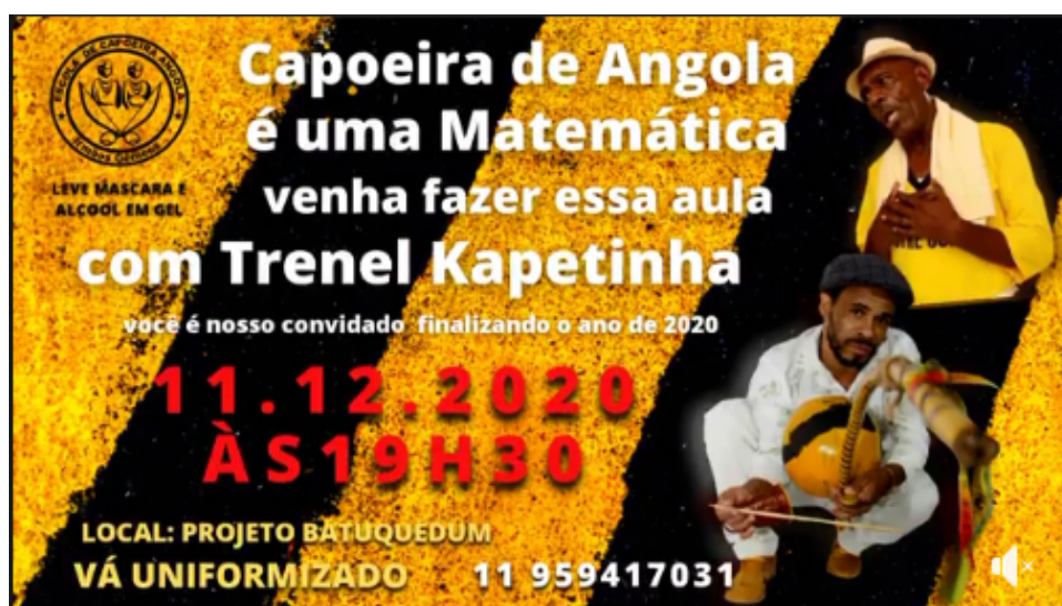
Fechamento das atividades/2020- Capoeira Angola