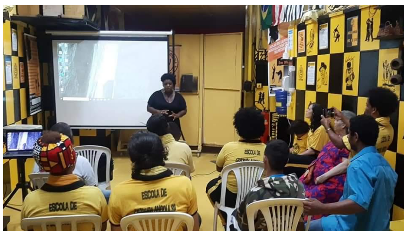
Palestra sobre Antropologia Yorubá (Mitos da ancestralidade)