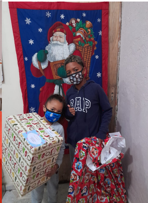
Entrega de presentes de Natal