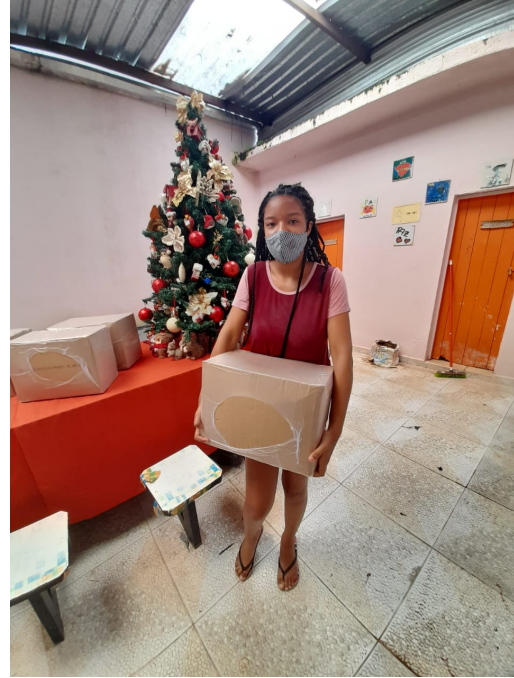
Entrega cestas básicas para responsáveis