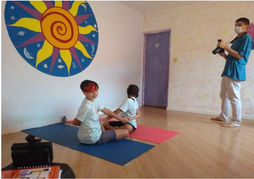
Crianças voluntárias na gravação do Yoga