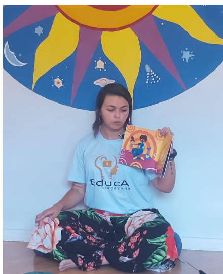
Professora voluntária na contação de histórias