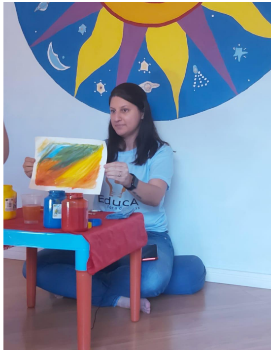
Professora mostrando como é feita uma pintura