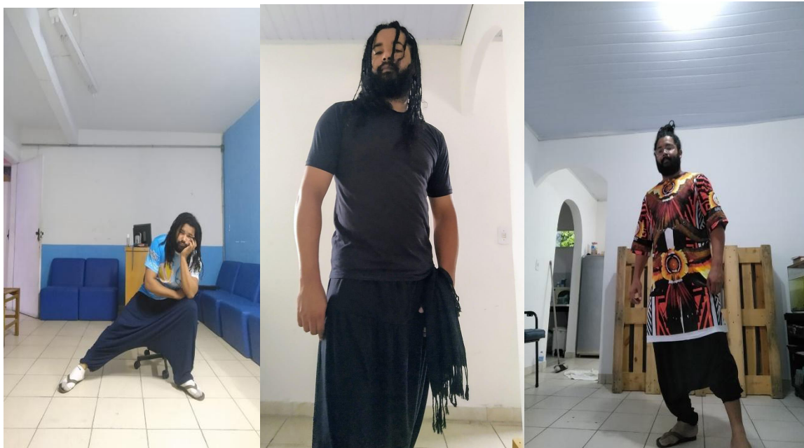
Teste de figurino para o módulo II dos Contos Sensíveis