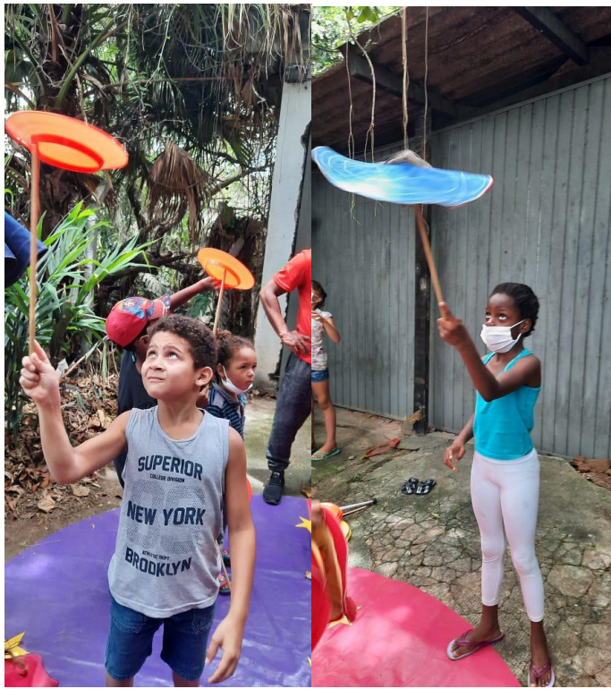
Aula de circo com pratos