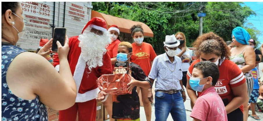
Festinha de encerramento em Dezembro de 2020. Houve doação de panetones da ONG Capão Cidadão