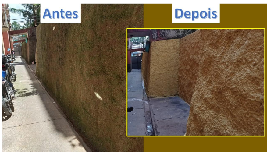
Muro que há 12 anos não era pintado