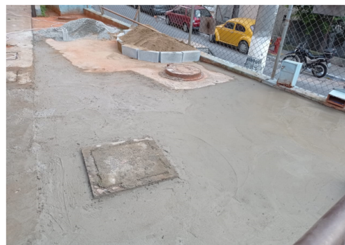
Reforma da área frontal de entrada ao lado do Bloco 1