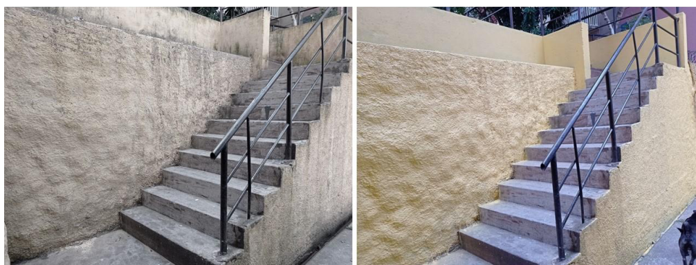
Revitalização de escada de acesso (direito) aos blocos 4 a 10