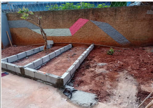
Criação de espaço para jardim comunitário