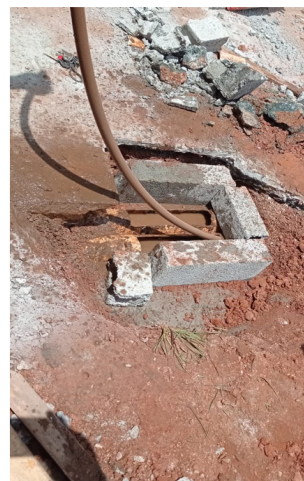
Desentupimento e criação de caixa de acesso para escoação de águas pluviais