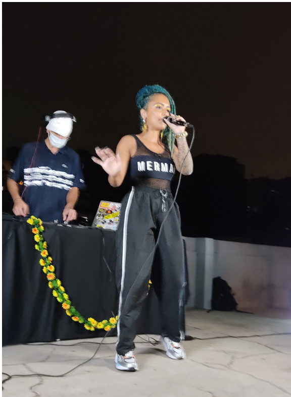
Pocket Show A'DRY (Prod. Ader)