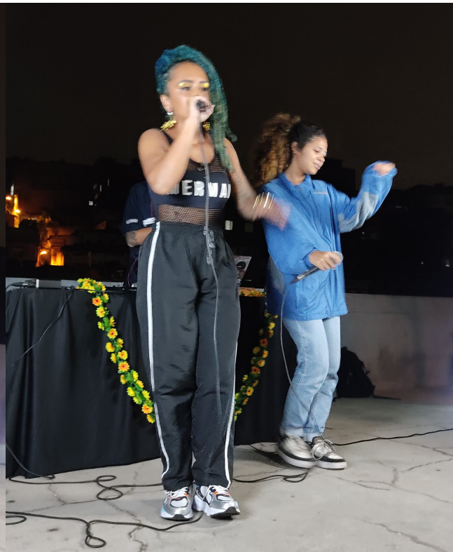
Pocket show ADRY e 011vivência