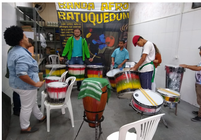
Oficina de Percussão Musical