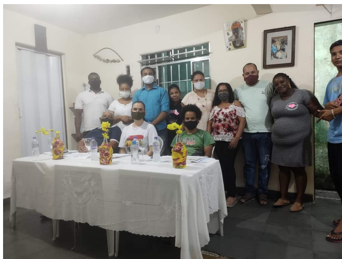
Conclusão do Curso de Desenvolvimento de Antropologia em Yorubá