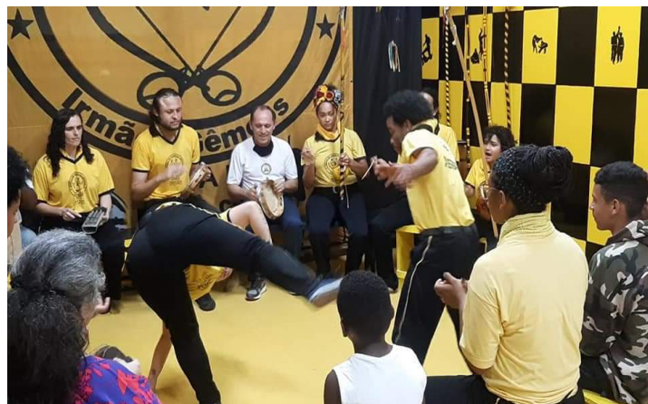
Oficina de Capoeira Angola