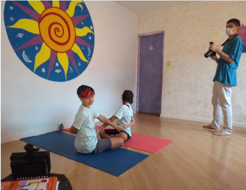
CRIANÇAS VOLUNTÁRIAS REGRAVANDO CENAS PARA OS VIDEOS