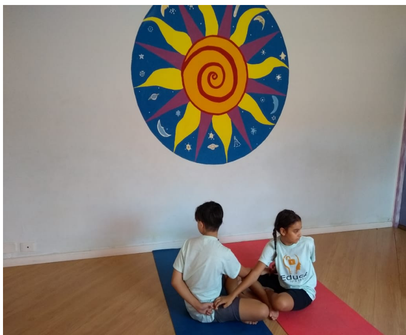
CRIANÇAS VOLUNTÁRIAS DURANTE UMA GRAVAÇÃO