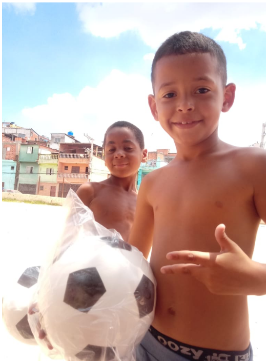
Entrega de bolas na Comunidade