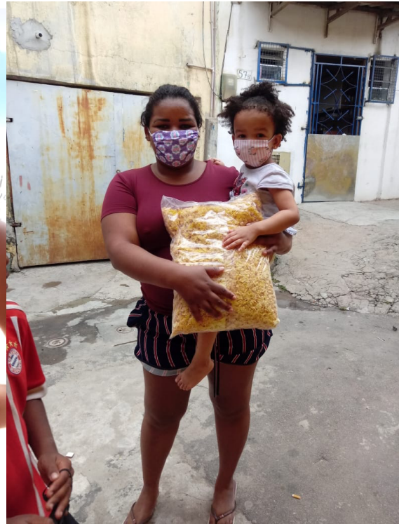
Entrega de Cereais para as mães