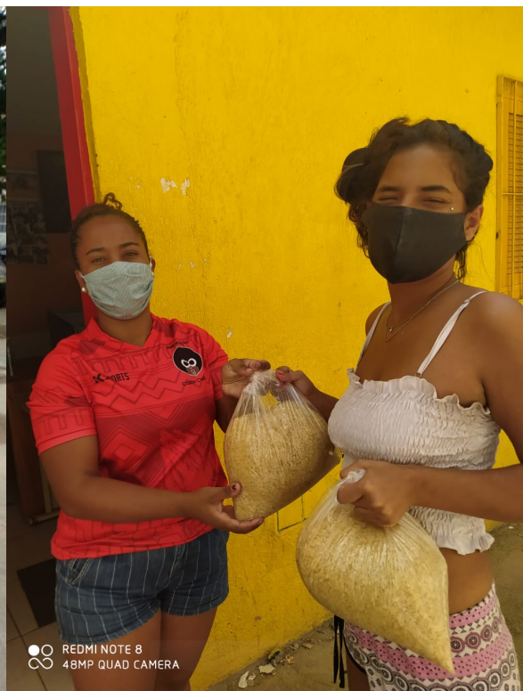
Entrega de arroz