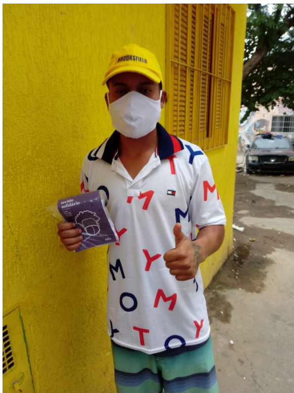
Entrega de máscaras