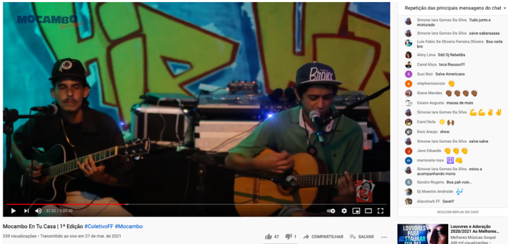
Live “Mocambo en tu casa”

Assista em: youtube.com/watch?v=-sP03CT_f2k ou facebook.com/coletivoforadefrequencia