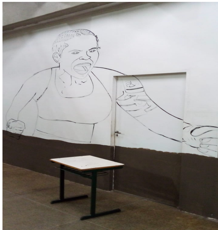
Oficina como usar um retroprojetor, ferramenta que ajuda a ampliar desenhos na parede