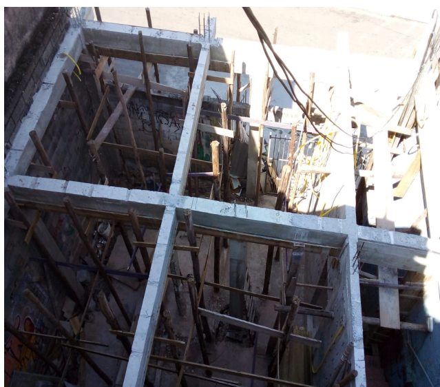
Tiramos tábuas das vigas