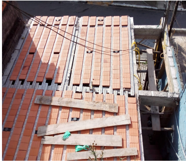
Vamos montar a laje e encher com concreto usinado pelo caminhão