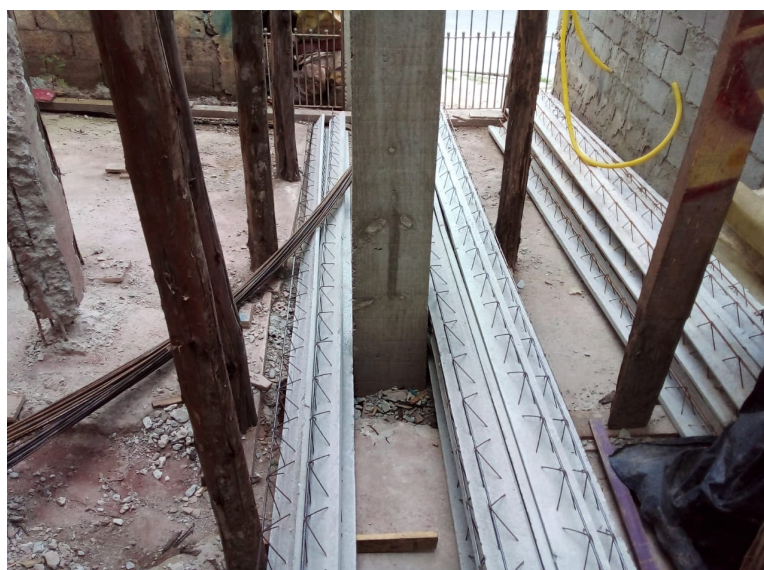
Compramos a laje completa, vigas, lajotas, ferros, concreto, bomba