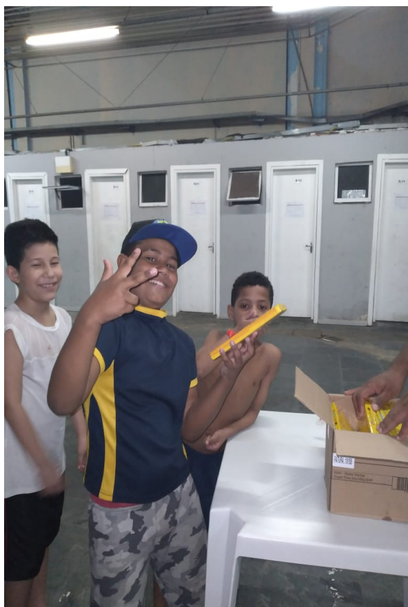
Entrega de biscoito para as crianças