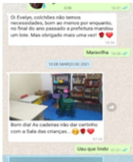
Cadeiras que doamos