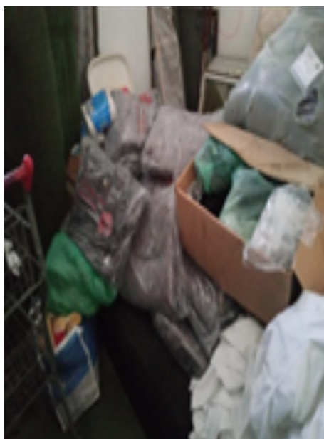
Parte das doações que deixamos lá