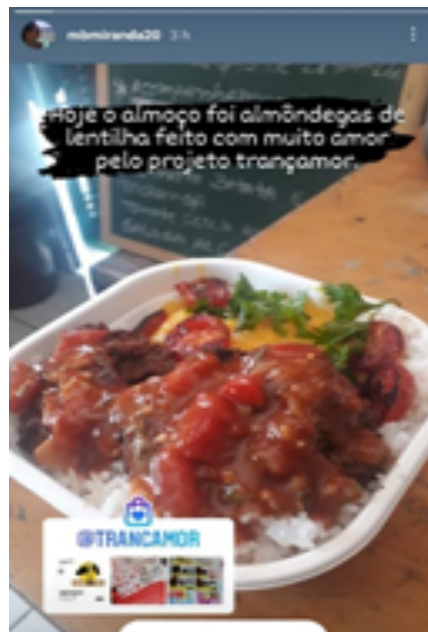
FEEDBACK DE NOSSO PRIMEIRO PRATO VEGANO