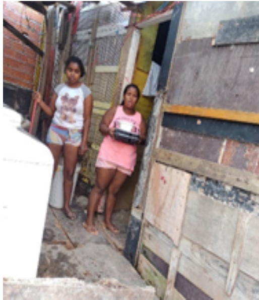
ENTREGA DE MARMITAS NO MORRO DO PULLMAN