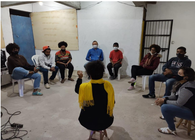
RODA DE CONVERSA- AÇÕES AFIRMATIVAS E NEGRITUDE