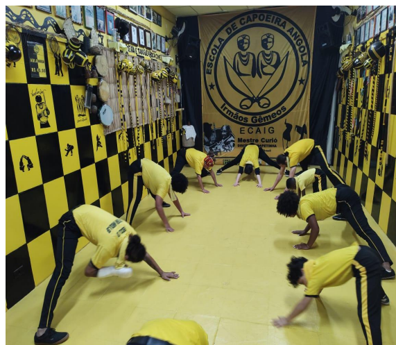
OFICINA DE CAPOEIRA ANGOLA