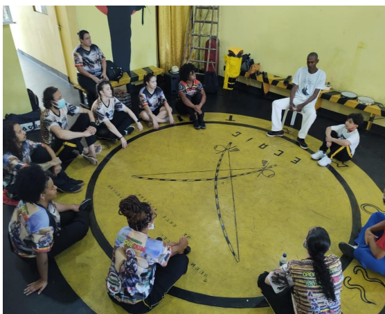
VIAGEM A SALVADOR EM HOMENAGENS AO MESTRE CURIÓ DE PASTINHA