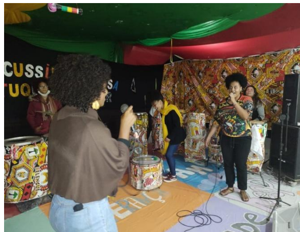
OFICINAS DE PERCUSSÃO MUSICAL E CANTO