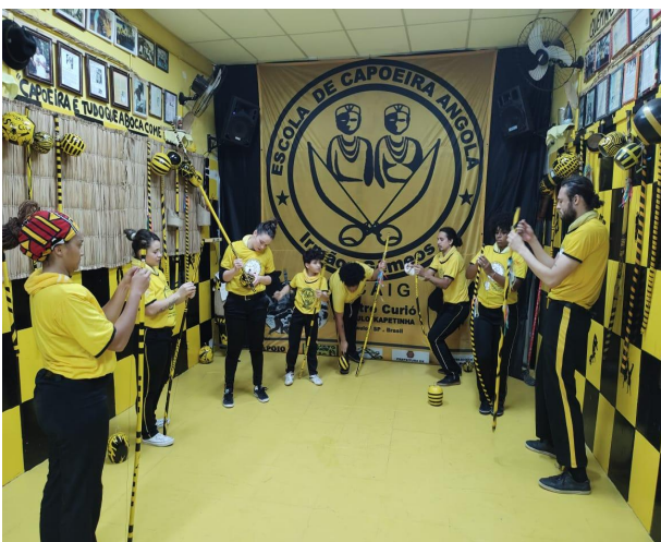
OFICINA DE INSTRUMENTOS (MONTAR, TOCAR E CANTAR)