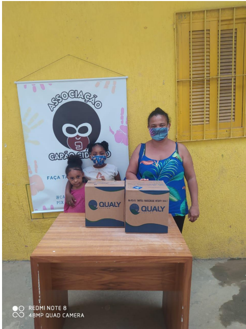
Entrega de Cestas UNEAFRO