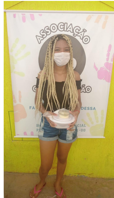
Entrega de Marmitas