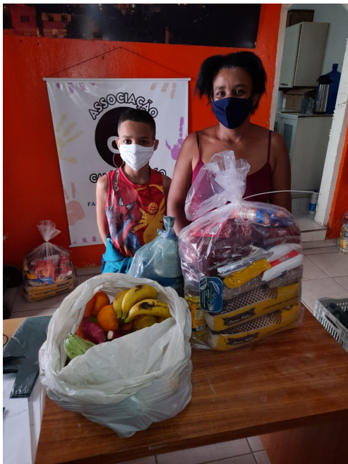
Entrega de cestas Solano