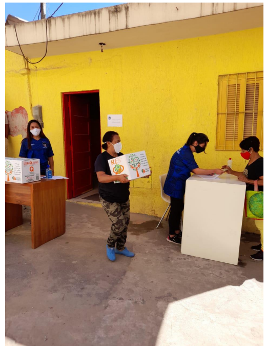
Entrega de cestas Kombosa