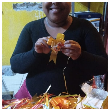
Confecção de Laços para enfeitar a cesta de dia das mães