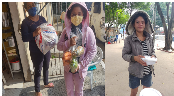
Entrega de Marmitas Verduras frutas e legumes na Avenida Fim de Semana Jardim São Luis