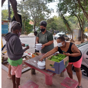
Entrega de Marmitas Verduras frutas e legumes na Avenida Fim de Semana Jardim São Luis