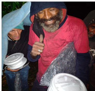
Entrega de Marmitas e Cobertores no Grajaú, essa ação foi feita pela Comunidade Terapêutica Semeando vidas, nós fornecemos os cobertores e alimentos para preparo das marmitas.