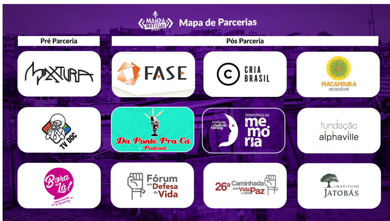
DIAGRAMA DA REDE: (desenhar aqui a sua rede com parcerias/apoiadores/voluntário/etc., e a cada mês complementar o desenho mostrando como sua rede tem se desenvolvido)

LINKS DOS POSTS NAS MÍDIAS SOCIAIS: (colocar aqui o link dos posts realizados no período sobre o apoio da Fundação ABH)